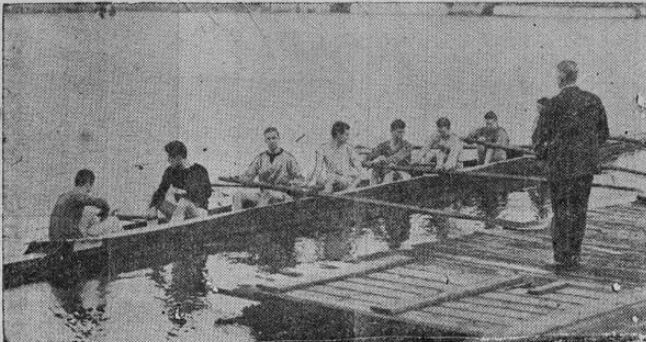
Los remeros de la Universidad de Harvard se entrenan para la regata anual con los de Cambridge, en el río Charles