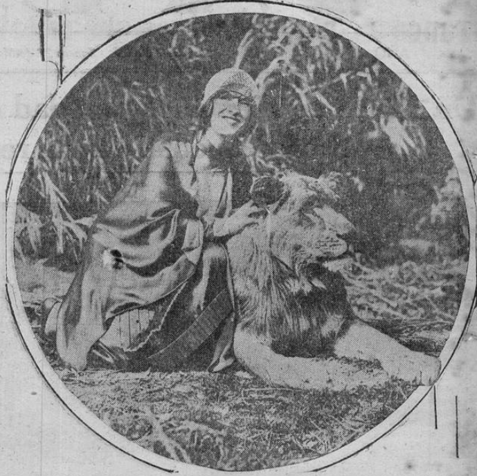
Aimee Semple Mc Pherson, la famosa evangelista de Los Angeles, no tiene miedo a los leones, y para probarlo se ha retratado aquí con Jacki en el jardín zoológico de dicha ciudad

Con motivo de vencer pronto el contrato de alumbrado público se elaborará el proyecto para la licitación de ese servicio