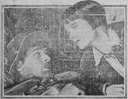
RICHARD ARLEN-LOUISE BROOKS IN THE WILLIAM A. WELLMAN PRODUCTION "MEN DIGOS OF LIFE" A PARAMOUNT PICTURE

Una película admirable de la "Paramount" se estrena esta noche en el Raventós en su selecto, y escogido jueves de moda. Una película bella, admirable y dramática que logrará sin duda alguna un grandioso éxito. Se titula "Mendigos de la Vida" y está interpretada por tres astros de la pantalla; la encantadora Louise Brooks, el admirable galán Richard Arlen y el notable característico Wallace Beery que en esta película hace su primera admirable creación dramática.