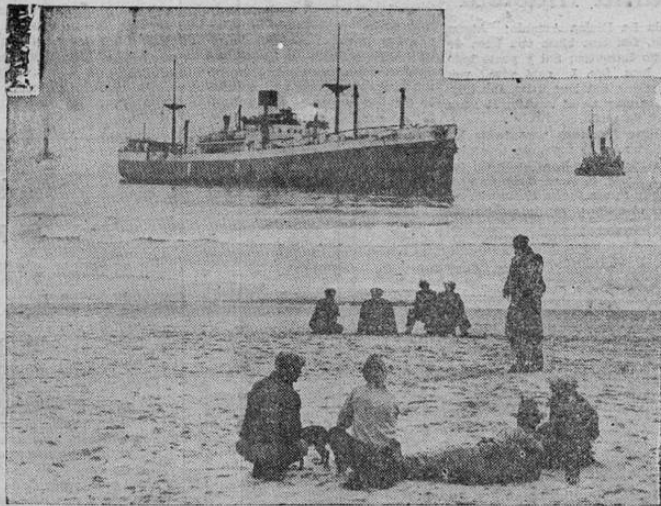
El barco-motor inglés CITY OF LILLE, que apenas cuenta unos dos años de haber sido lanzado al agua, acaba de encallar en la costa de California, considerándose imposible salvarle