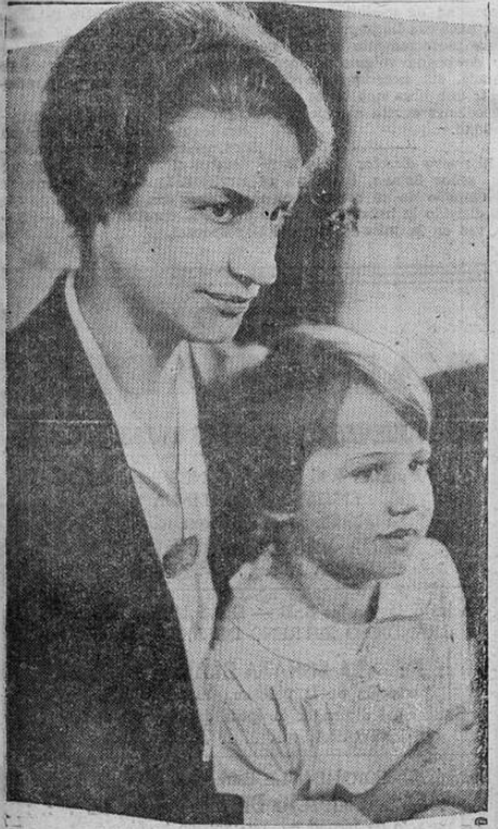
Esta es la última fotografía de Mrs Mable Wi Willebrandt, ex-subprocurador general de los Estados Unidos. La acompaña su hija adoptiva, Dorothy